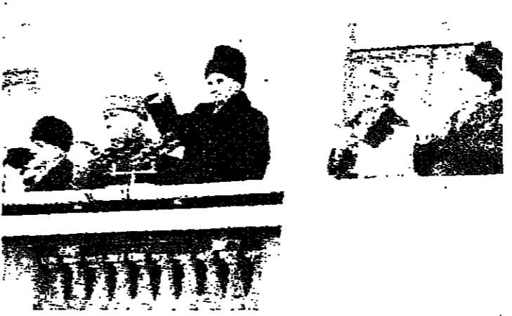
تشاوتشيسكو يلوح للجماهير

وزير الخارجية السوفياتية فاديم بوليفيف أمس بأنه اذا ما تأكدت الأنباء التي تشير الى سقوط أكثر من ألف قتيل في رومانيا، فإن الاتحاد السوفياتي يشعر بـ... الاسي والالاف... وأضاف المتحدث خلال مؤتمر صحفي ان الاتحاد السوفياتي لا يمكنه ان يتصل بعد الى رومانيا، وان الحكومة السوفياتية لا تملك معلومات اخرى في الوقت الحالي.